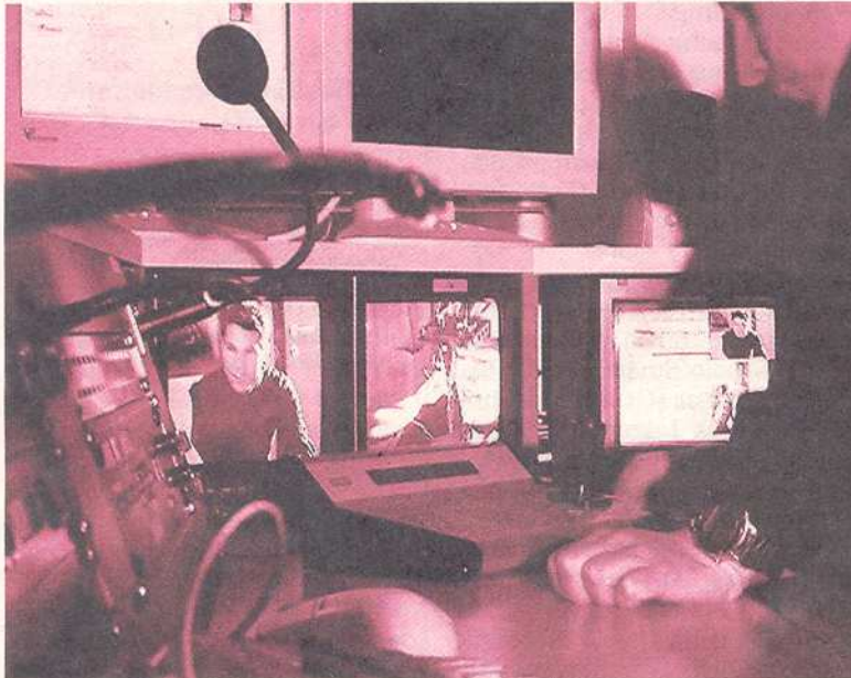
Benutzerfreundlichkeit ist ein Schlüssel zum Erfolg.

▶ 17. Februar, 16.00 bis 17.00 Uhr. Marketing und Usability – zwei Seiten einer Medaille.