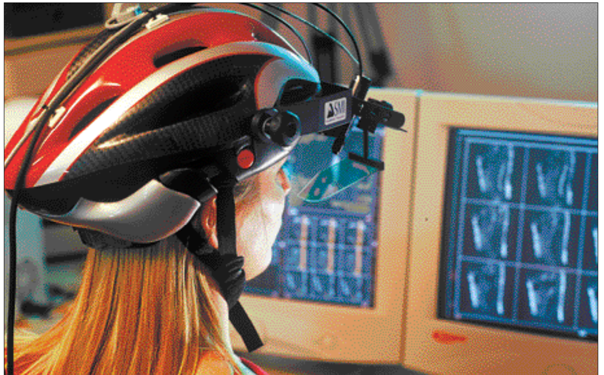
In den Cure-Usability-Labs werden unterschiedlichste Szenarien simuliert; so kann mit dem sogenannten „Eye-Tracking“ festgestellt werden, wie ein Benutzer Bildbewegungen verfolgt.

Die Vision von Cure liegt in der Schaffung einer benutzbaren Umwelt, in welcher Technologien und Systeme die Menschen in ihren täglichen Anforderungen scheinbar nahtlos unterstützen. Das Zentrum verfügt dafür über eines der weltweit modernsten Forschungs- und Testlaboratorien in seiner Art. Mit über 300 Projekten und rund 200 Projektpartnern aus 15 Ländern in rund 20 verschiedenen Anwendungsbereichen ist Cure heute eine der führenden Organisationen auf dem Gebiet der Usability-Forschung in Europa.